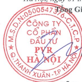
Đỗ Duy Điền